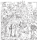
Ordine degli Ingegneri della provincia di Bergamo

Il seminario contribuirà poi alla formazione della "cultura" del costruire in acciaio con il supporto di progettisti e docenti universitari di chiara fama, che illustreranno la grande opportunità offerta dall'acciaio per versatilità, affidabilità, efficienza, sostenibilità e sicurezza anche in zona sismica.