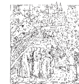
Ordine degli Ingegneri della provincia di Bergamo