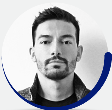
arch. TOMAS GHISELLINI Tomas Ghisellini Architetti